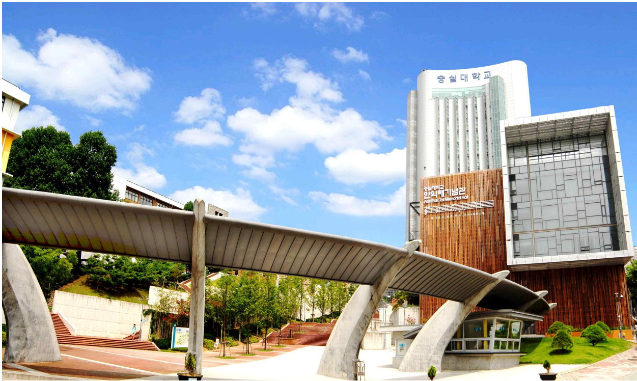
【송실대학교 정문 전경】